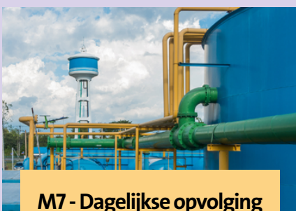
M7 - Dagelijkse opvolging van WZI's: Tips & Tricks