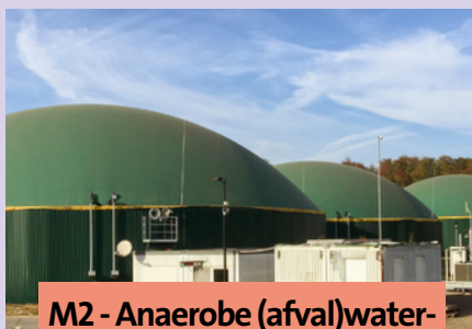
M2 - Anaerobe (afval)water- behandeling