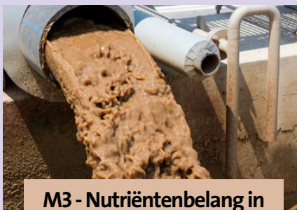
M3 - Nutriëntenbelang in afvalwaterbehandeling