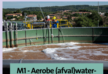
M1 - Aerobe (afval)water- behandeling