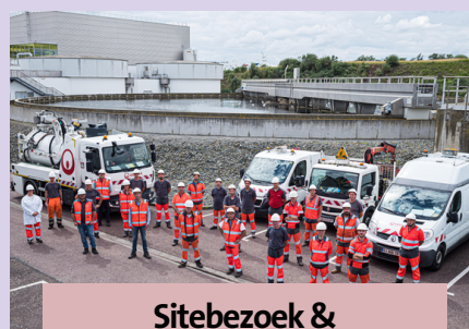
Sitebezoek & Syntheseworkshop